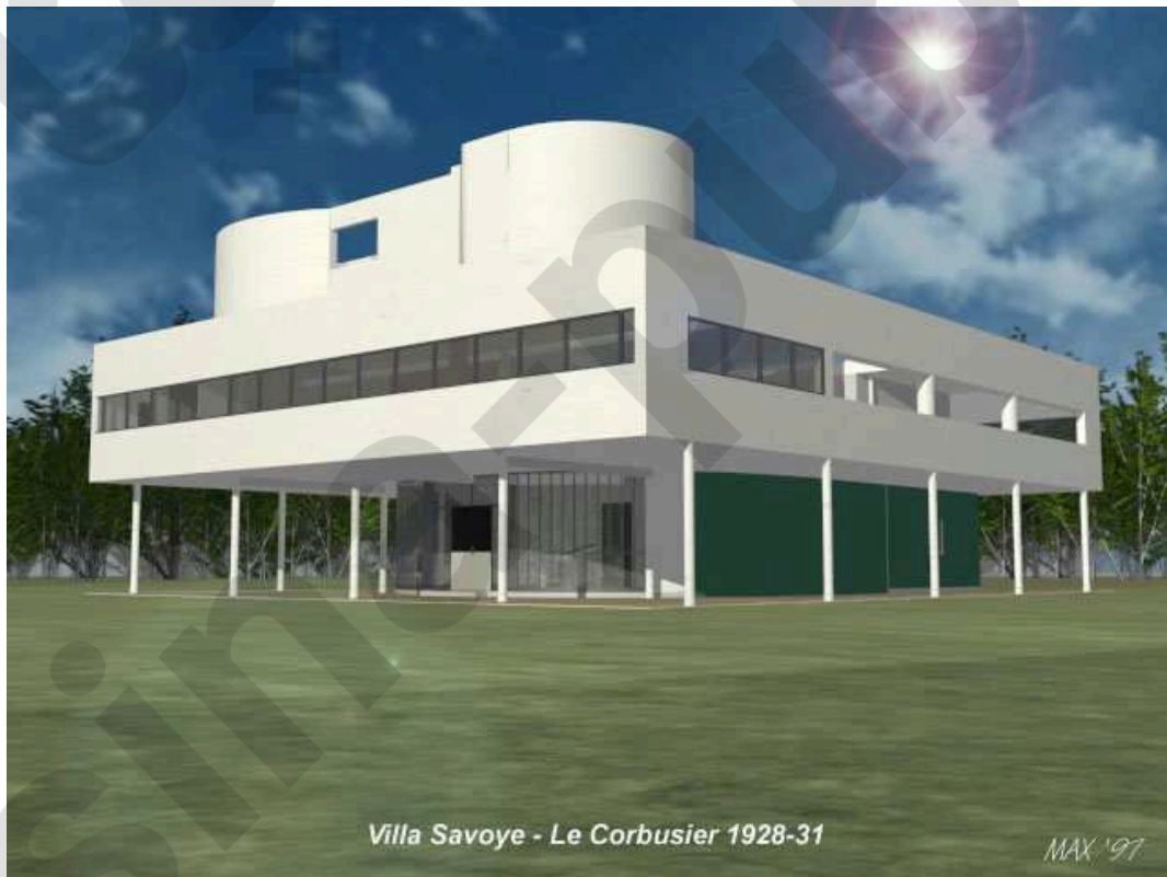
Villa Savoye - Le Corbusier 1928-31