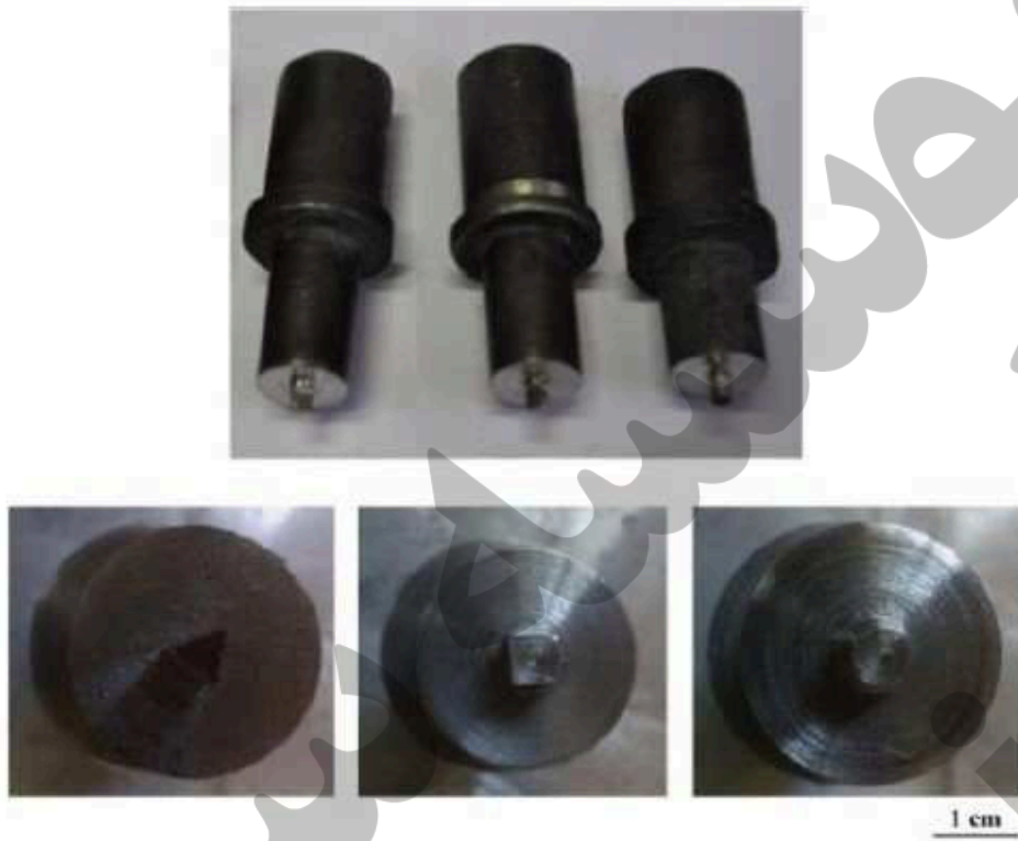
شکل 1 - برش های عرضی پین ابزار FSW.